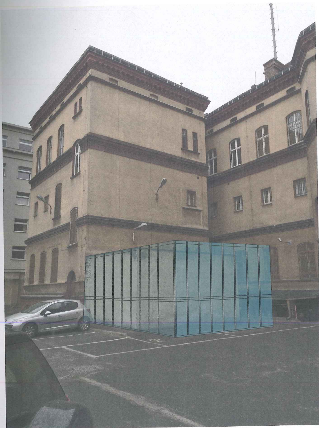
DOBUDOWA SALI ODPRAW