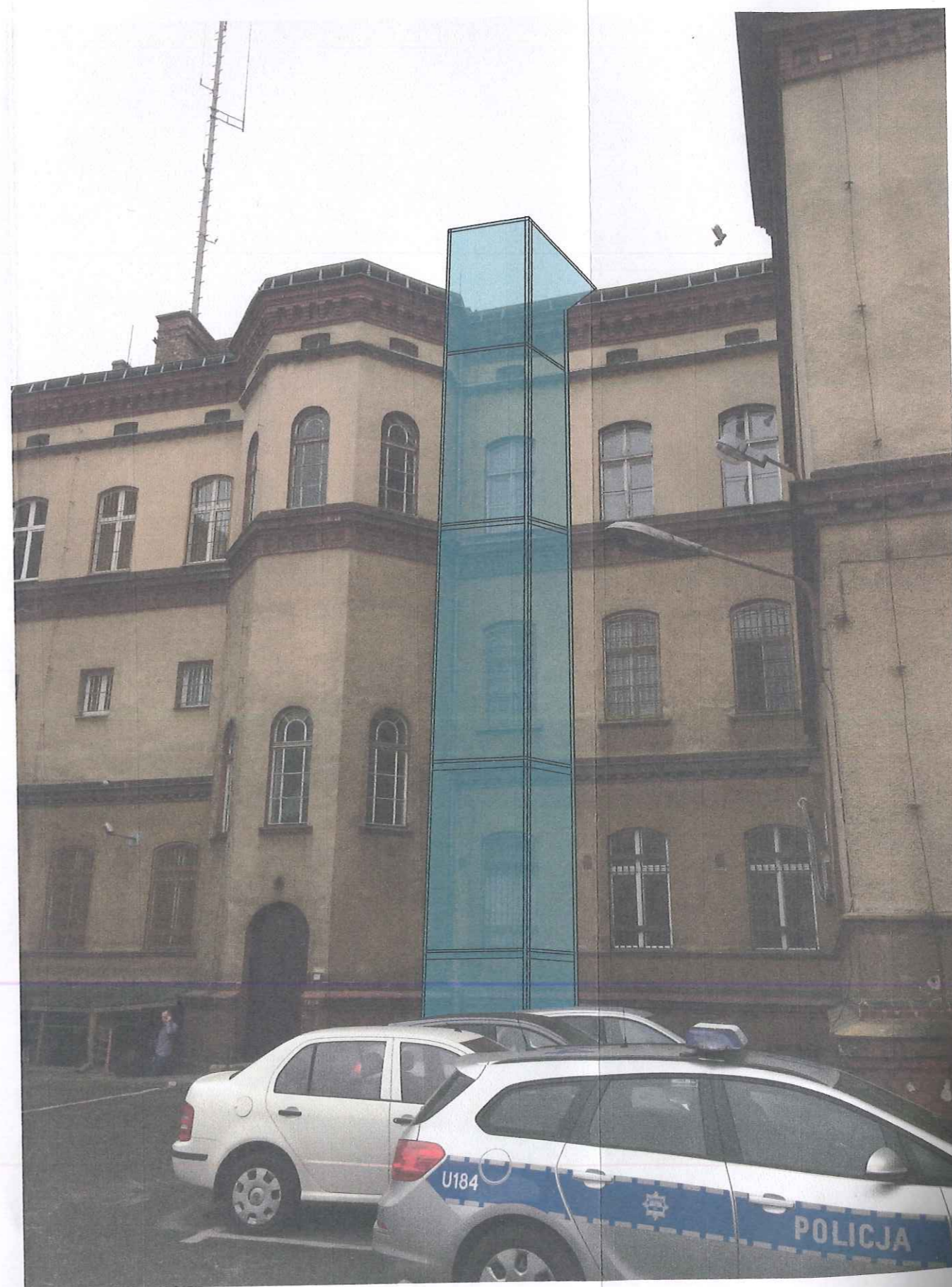
DOBUDOWA ZEWNĘTRZNEJ WINDY PANORAMICZNEJ